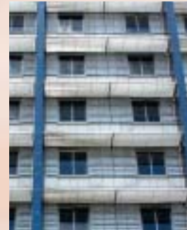
Evangelisches Krankenhaus Hattingen Akademisches Lehrkrankenhaus d. Ruhr-Universität Bochum

Ein Schwerpunkt-Krankenhaus der Evangelischen Stiftung Augusta